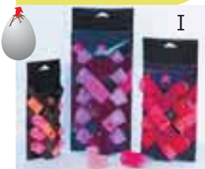
Серія паковань для бігуді-липушок «Жадана» Ковтун Дарина, НАОМА