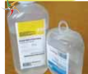
Флакони поліетиленові з етикеткою в лінійці «Натрію хлорид», «Розчин Рінгера» ТОВ «Ніко»