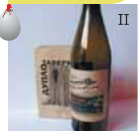
Серія упаковок для таверни «Дупло» Ткачев Дмитро, ХНУРЕ