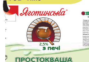
«Простокваша з печі» у полістирольному стакані від ТМ «Яготинське» ПрАТ «Молочний альянс»