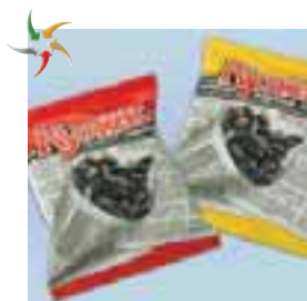
Упаковка для смаженого насіння ПАТ «Укрпластик»