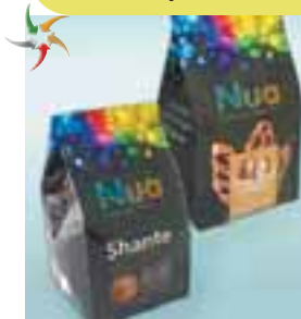
Упаковка для цукерок Nua ПАТ «Укрпластик»