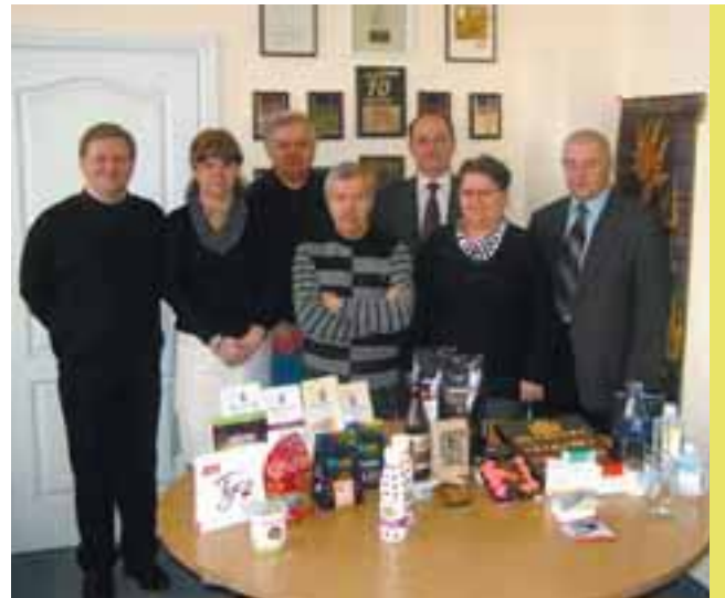
Журі конкурсів із зразками переможців