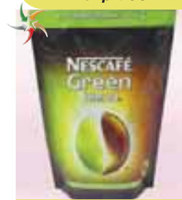
Упаковка для кави Nescafe Green blend ПАТ «Укрпластик»