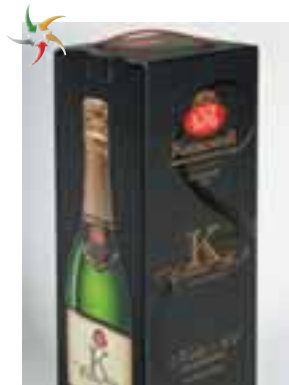
Упаковка для шампанського (6 л) ТОВ «Ельграф»