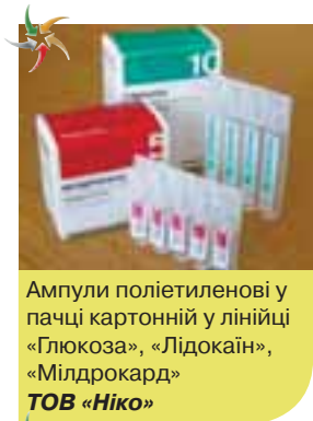
Ампули поліетиленові у пачці картонній у лінійці «Глюкоза», «Лідокаїн», «Мілдрокард» ТОВ «Ніко»