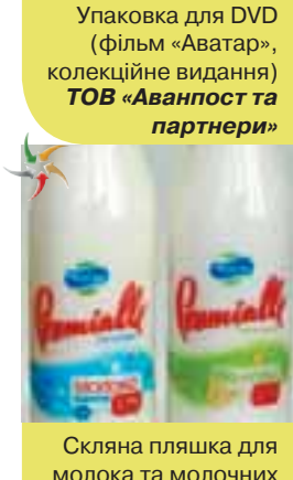
Скляна пляшка для молока та молочних продуктів Premiale ПАТ «Ветропак Гостомельський склозавод»