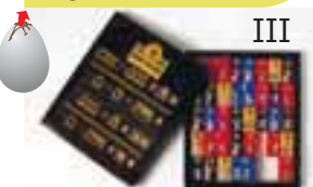
Пакування для шоколадних цукерок «Княжа забава» ТМ «Знатні солодощі» Сочівець Анастасія, НАОМА