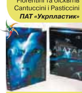
Упаковка для DVD (фільм «Аватар», колекційне видання) ТОВ «Аванпост та партнери»