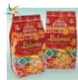
Упаковка для печива Laima ПАТ «Укрпластик»