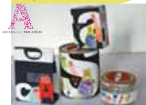
Серія упаковок корму для котів «Мявка» Світлична Анастасія, ДНУ