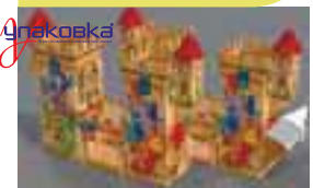
Коробка для новорічного подарунка «Замок драконів» ПАТ «Рубіжанський картонно-тарний комбінат»