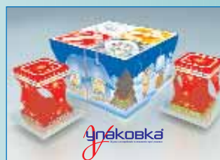
Упаковка подарункова з елементами лентікуляру