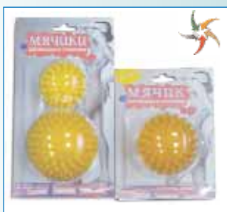
Упаковка «М'ячки для масажу та тренування»