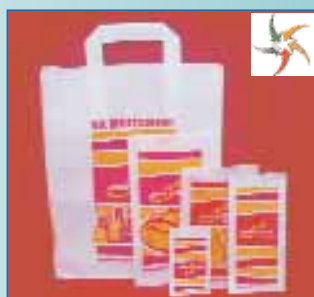
Серія пакетів Andy's pizza