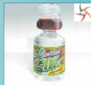
Двокамерна ПЕТ-пляшка «пуш-топ»

ТОВ «Нешкідливі технології і продукти «Грін Оул», м. Рівне