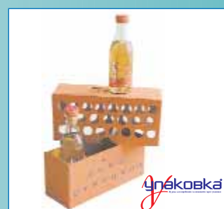
Упаковка «День будівельника. Висок»