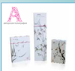
Серія пакувань для художніх матеріалів ТМ «Чотири благородних»