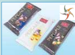
Серія упаковок для шоколаду PERGALE з лісовим горіхом, із карамельною та трюфельною начинками