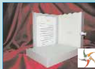
Коробка для картки VISA Platinum Private Banking від OTP Bank