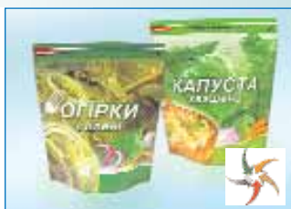
Серія упаковок для огірків солоних та капусти квашеної