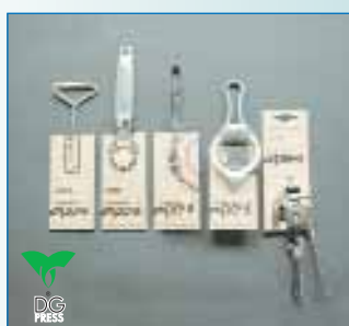
Упаковка-утримувач «Розумні речі до речі»

ДП «Видавничий дім «Укрпол» ТзОВ «Укрпол ЛТД», м. Стрий, Львівська обл.