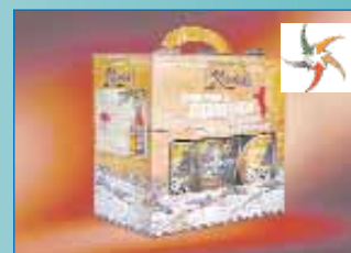
Упаковка для набору пива «Велкоповицький козел»

Поліграфічна компанія «Профі-Прес», м. Макіївка