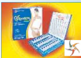
Упаковка для капсул «Дієтон»

ТОВ «Нешкідливі технології і продукти «Грін Оул», м. Рівне