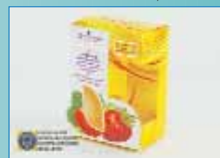
Упаковка для крему для рук «Мой наприз»

ДП «Видавничий дім «Укрпол» ТзОВ «Укрпол ЛТД», м. Стрий, Львівська обл.