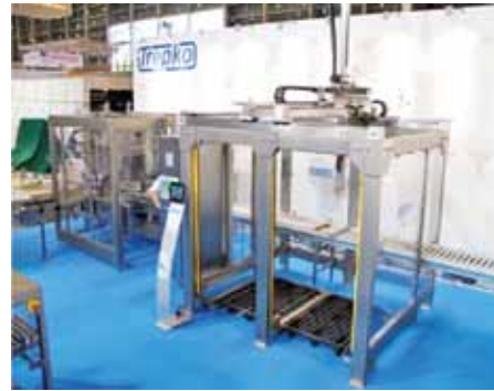
Серия 740 — двойная система паллетизации

идентификацию продукта, удобное и быстрое вскрытие групповой упаковки для пополнения магазинных полок, удобный и неограниченный доступ к продукту, а также простую утилизацию отходов упаковки.