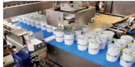
Групповая упаковка стаканчиков