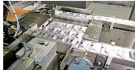
Групповая упаковка брикетов