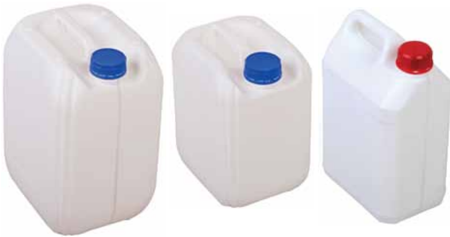
Канистра «Адер» 10 л