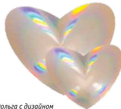
Фольга с дизайном «сердце»

Пространственная глубина линз, эффект преломления света и игра цветов создают неповторимое впечатление. Именно поэтому компания Kurz рекомендует использовать фольгу с эффектом линзы, прежде всего, для оформления упаковки. Созданная фольга с привлекающими внимание эффектами, при продаже продукции без преувеличения является «приманкой для глаз». Новые дизайны придают неповторимость упаковке, вместе с которой значительно увеличивается конкурентное преимущество продукции.